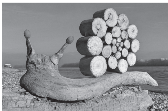
Figura 4 – Driftwood art-snail , de Tamas Kanya, Hungria