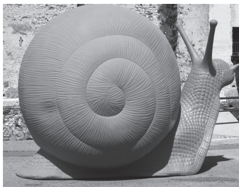
Figura 2 – Pink snail , escultura de artistas do Cracking Art Group