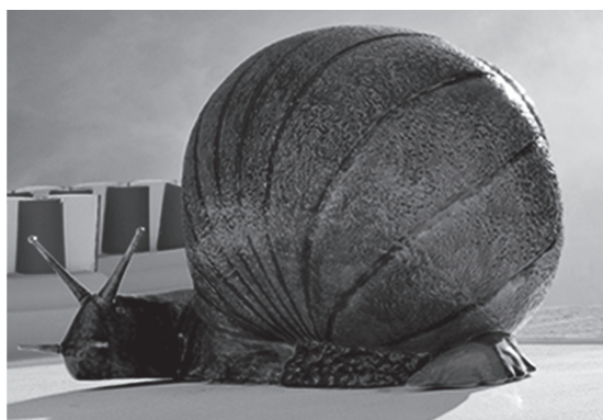
Figura 3 – Caracol , escultura cerâmica de Rafael Bordalo Pinheiro